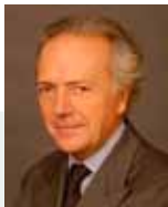
E. Carmignac, Beheerder

Carmignac Investissement is een internationaal aandelenfonds dat belegt in financiële markten overal ter wereld. De aandelenblootstelling is permanent hoger dan 60% van de nettoactiva. Het fonds richt zich op een aanbevolen beleggingshorizon van 5 jaar met als doelstelling zo goed mogelijke resultaten te behalen via een actief en opportunistisch beheer, zonder vooraf vastgelegde vereisten ten aanzien van assetallocatie naar geografische zone, sector, type of omvang van effecten. De rendementsbronnen van het fonds zijn dus aandelen, maar tevens valuta's en in sommige gevallen renteproducten.