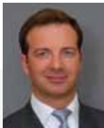
F.-J. Furry Beheerder

Een flexibel beheer om te profiteren van alle marktomstandigheden